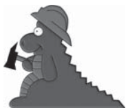
Dráček Hasič - logo programu

V dnešní době jsou občané stále více ohroženi u d a l o s t m i typu požárů, dopravních nehod, havárií v chemickém provozu, radiálních havárií, různými druhy živelních pohrom, teroristických akcí apod. Při vzniku mimořádné události je povinností hasičského záchranného sboru a složek integrovaného záchranného systému poskytnout občanům veškerou pomoc. Stejně důležitá je však připravenost člověka umět požárům a jiným událostem předcházet a dokázat se v počátečním stavu ohrožení postarat sám o sebe a své nejbližší. Mezi jednu s požárem nebo jinou mimořádnou událostí nejvíce ohrožených skupin obyvatel patří děti.