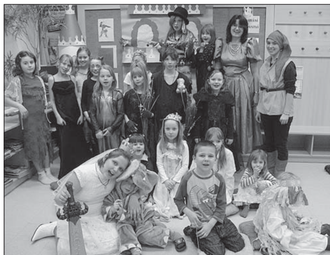
Otvírat království není vůbec lehká věc, jak se přesvědčily děti v únoru v knihovnách na ulicích Daliborova a J. Trnky.

„Březen – měsíc čtenářů“ - letošní březen je věnován všem čtenářům. V rámci tohoto měsíce proběhne na pobočkách Knihovny města Ostravy: