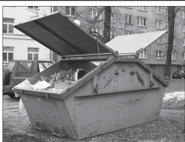
Seznam stanovišť a data přistavení kontejnerů pro svoz a likvidaci velkoobjemových odpadů